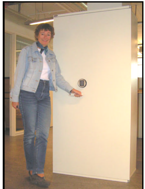
Barbro säger skämtsamt att i detta kassaskåp förvaras svenskarnas skattepengar...

- Inom Skatteverkets område, beskattning och beräkning av pensionsgrundande inkomst, behandlas subventionen/förmånen som lön, och tas upp till beskattning och ingår i be-