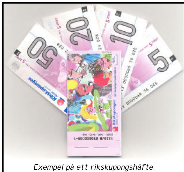
Exempel på ett rikskupongshäfte.

Preliminärskatten beräknas på den intjänade lönen plus eventuella förmåner, medan skatten dras enbart från den intjänade lönen.